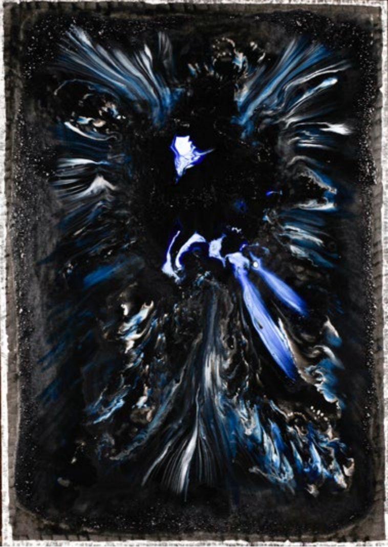
Mixed Tecnique on Canvas / Epoxy 140x100 cm 2017 Tuval Üzerine Karışık Teknik / Epoksi 140x100 cm 2017