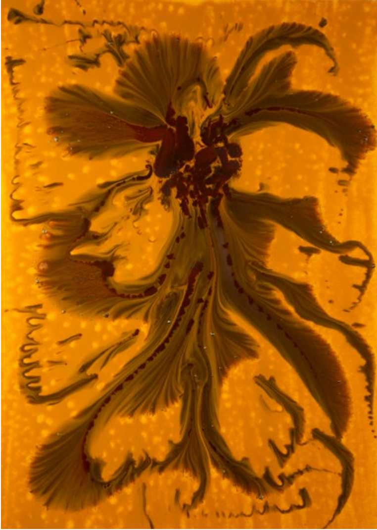
Mixed Technique on Canvas / Epoxy 140x100 cm 2017 Tuval Üzerine Karışık Teknik / Epoksi 140x100 cm 2017

A number of abstract images provide evolutionary integrity. This process leaves us with ourselves by questioning the first breath of one's life, the shopping of life, and the life cycle between the past and the future. Cengiz Yatağan establishes a deep, rare relationship between spiritualism and plastic arts. Yatağan's paintings create a spiritual energy field.