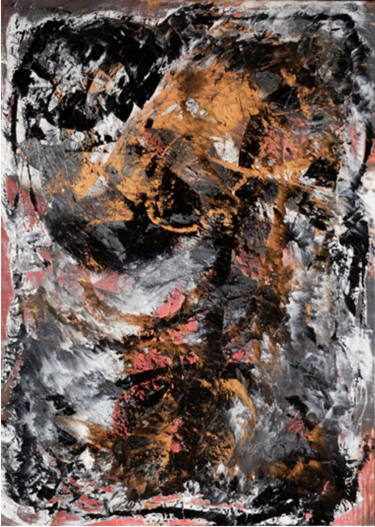
Mixed Technique on Canvas / Epoxy 140x100 cm 2017 Tuval Üzerine Karışık Teknik / Epoksi 140x100 cm 2017

From here, we can easily say that the artist has created a new language by blending the transparent material we see in his works with various materials.