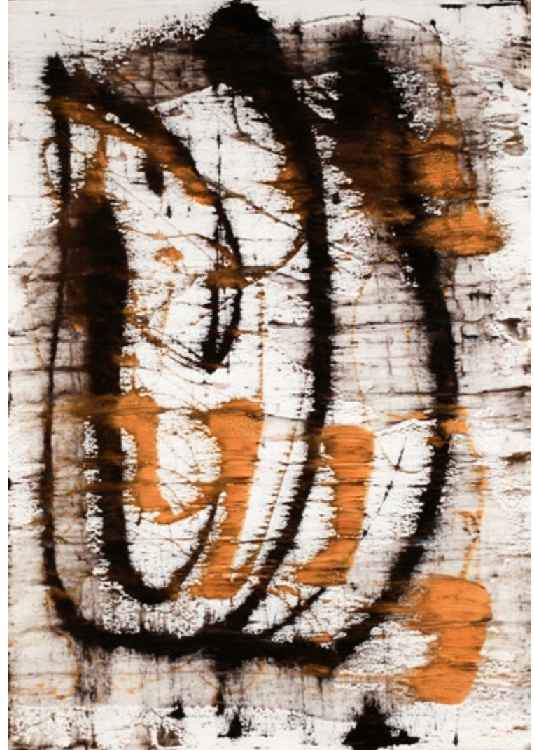
Mixed Tecnique on Canvas / Epoxy 140x100 cm 2017 Tuval Üzerine Karışık Teknik / Epoksi 140x100 cm 2017