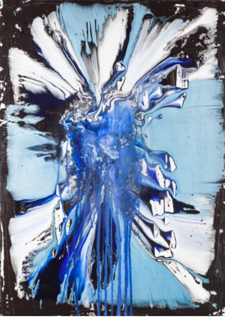
Mixed Tecnique on Canvas / Epoxy 140x100 cm 2017 Tuval Üzerine Karışık Teknik / Epoksi 140x100 cm 2017

The personal and participating group exhibitions that are performed in the previous years by the artist, especially acrylic paintings on canvas, consist of abstract works which do not refer to the objectivity like an organism which is dependent on its parts as a whole in its traditional understanding.